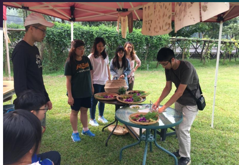
敲拓染體驗 銘泉生態農場