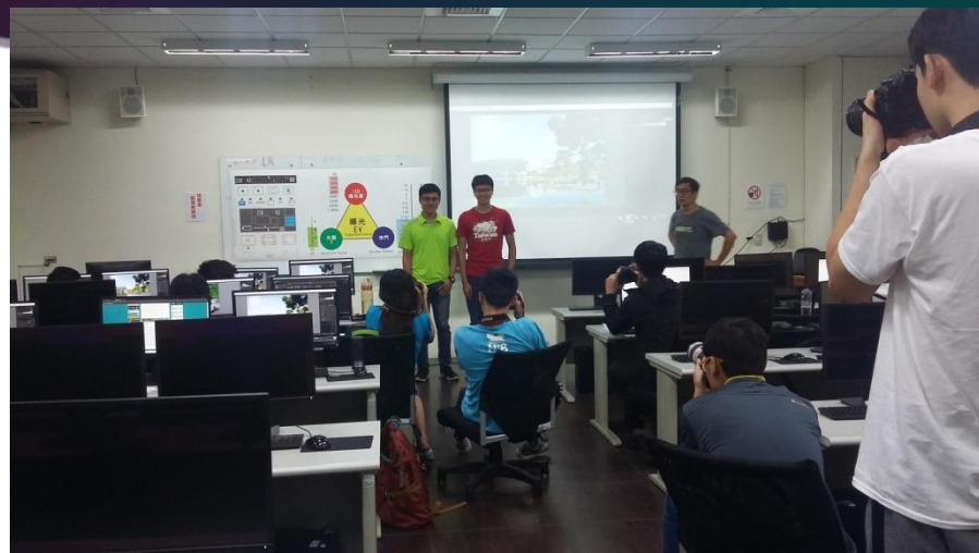
學生實際操作相機瞭解上課所學