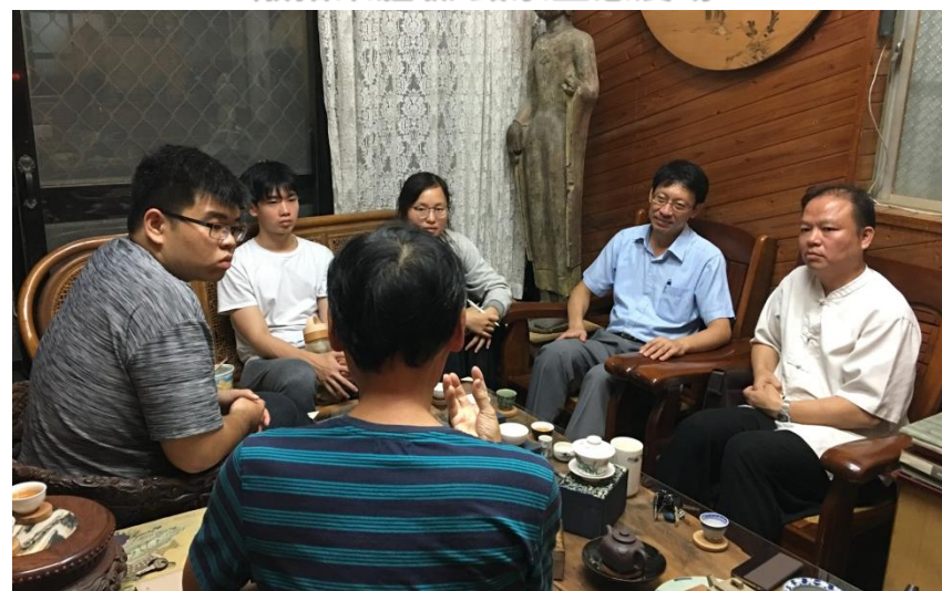
拜訪微型企業 墨仙堂