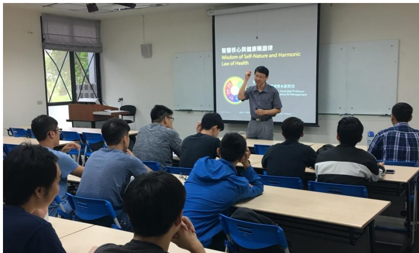
老師講解健康簡諧率