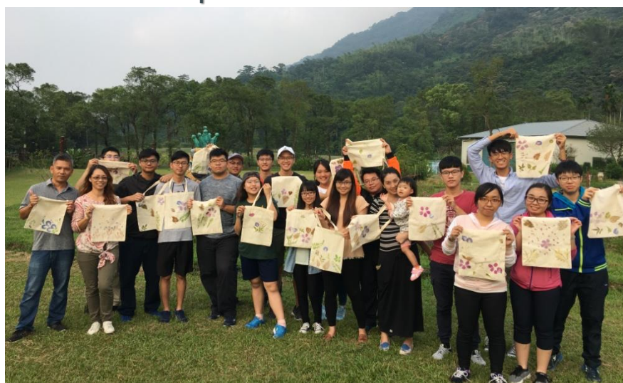
學生進行企業參訪 銘泉生態農場