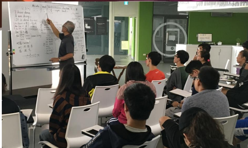
老師講解如何使英文不難