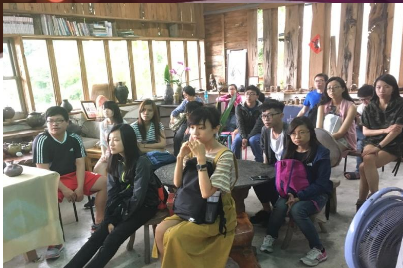
學生進行企業參訪 九鳥陶燒