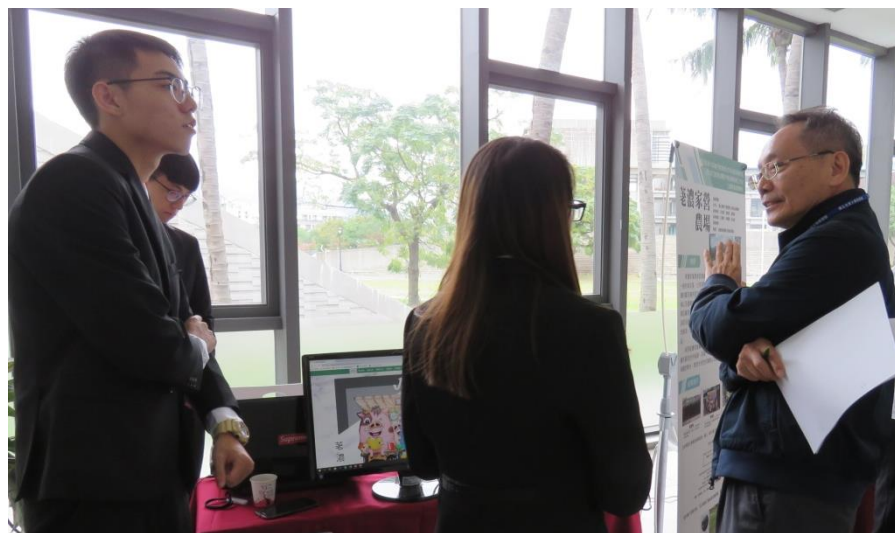
學生為參觀者解惑