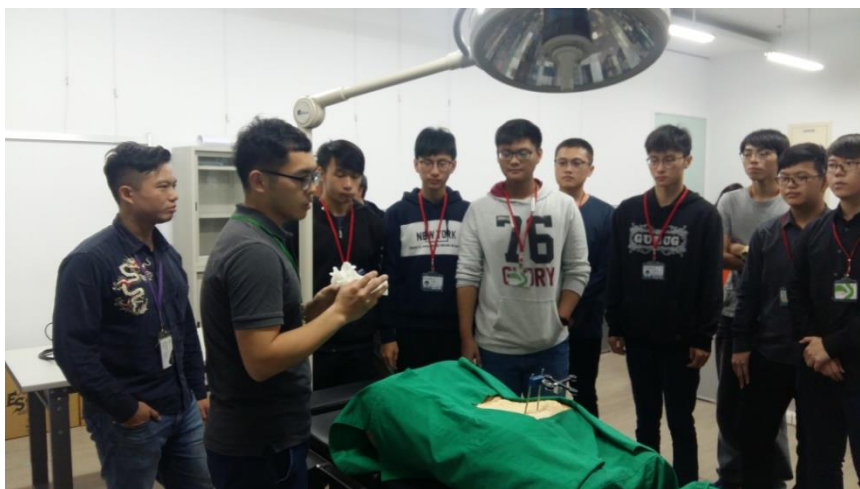
學生進行企業參訪 炳碩生醫