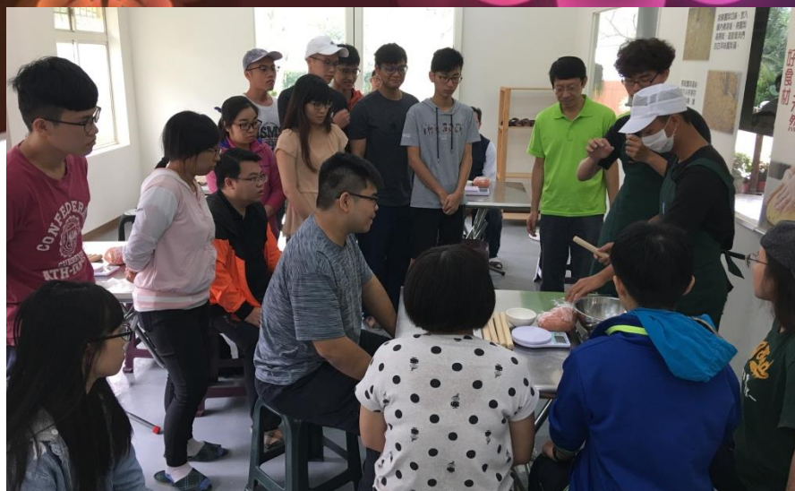
手工pizza體驗 銘泉生態農場