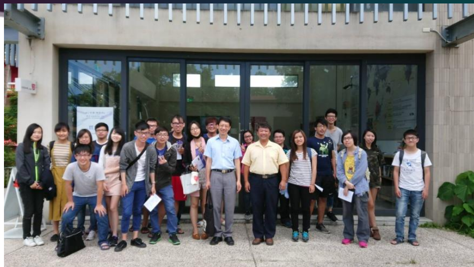
帶領學生進行企業參訪 艾蘭哥爾咖啡