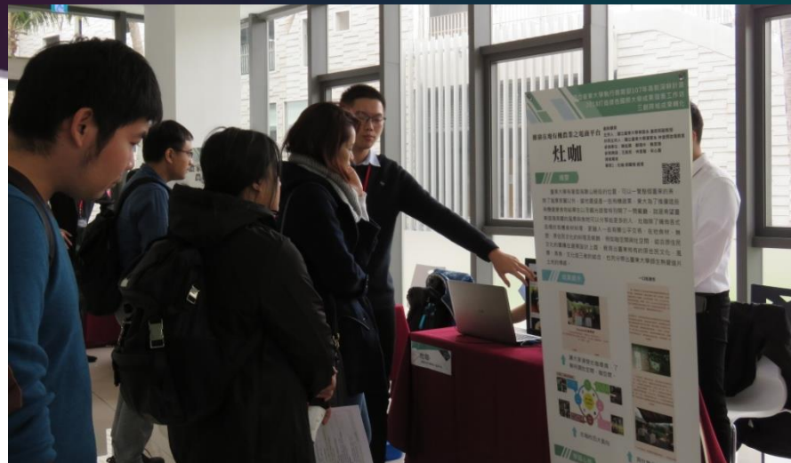
學生介紹小組成果