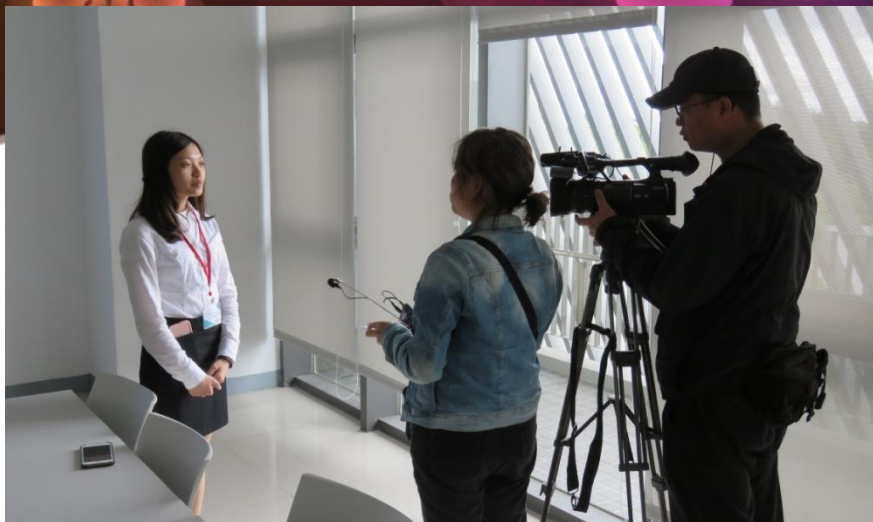
成果展當日記者採訪